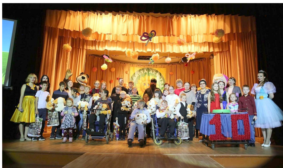
Рязанский колледж культуры

Рязанский колледж культуры совместно с отделом по Чучковскому и Шацкому районам ГКУ РО Управления социальной защиты населения Рязанской области активно участвует в организации и проведении ежегодного фестиваля «Планета детства и добра» для детей-инвалидов.