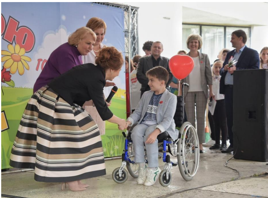
Проект «Дорогою добра»