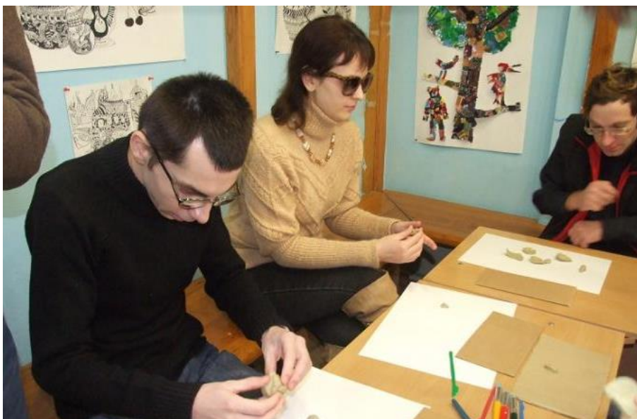
Рязанское художественное училище им. Г.К. Вагнера

Рязанский колледж культуры совместно с отделом по Чучковскому и Шацкому районам ГКУ РО Управления социальной защиты населения Рязанской области активно участвует в организации и проведении ежегодного фестиваля «Планета детства и добра» для детей-инвалидов.