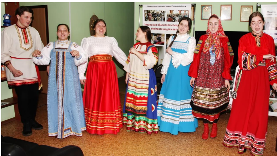
Рязанский музыкальный колледж им. Г. и А. Пироговых

Рязанский музыкальный колледж им. Г. и А. Пироговых с концертными программами выступает для членов региональных организация ВОИ и ВОС, учащихся коррекционных школ.