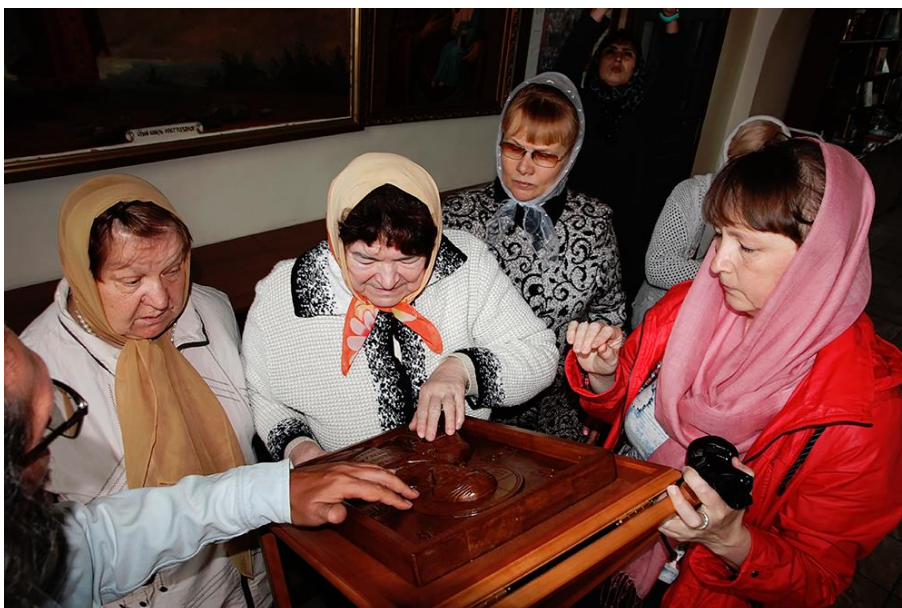
Проект «Открой мечту» ГБУК РО «РОСБС»