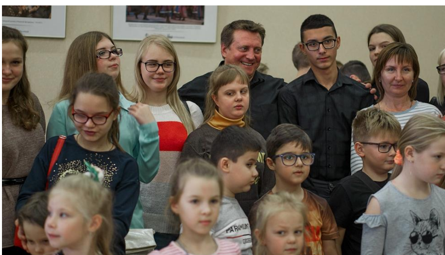
Рязанская областная филармония