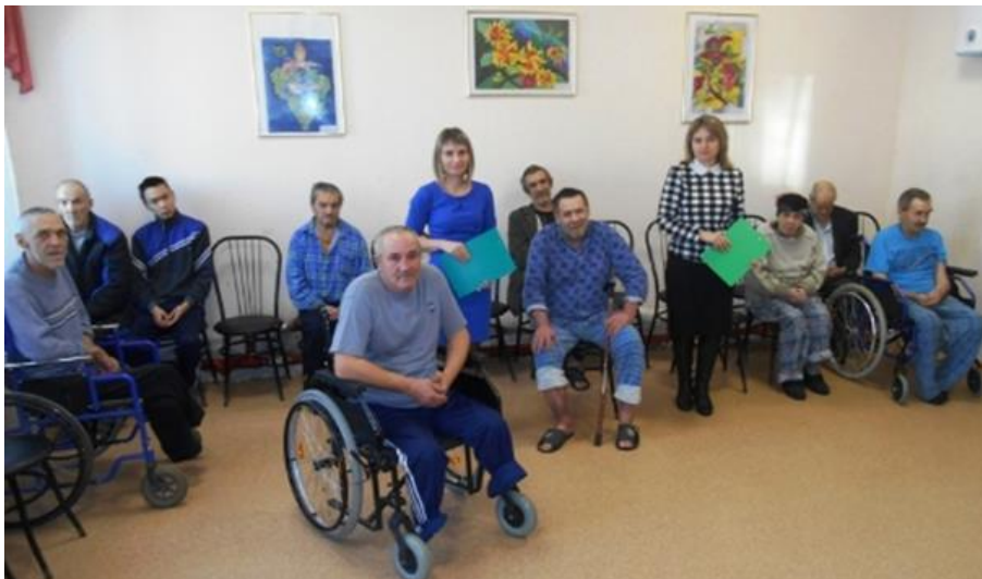
Библиотечное мероприятие в доме-интернате для престарелых и инвалидов, г. Касимов

Большой вклад в социокультурную реабилитацию инвалидов вносят также муниципальные краеведческие музеи.