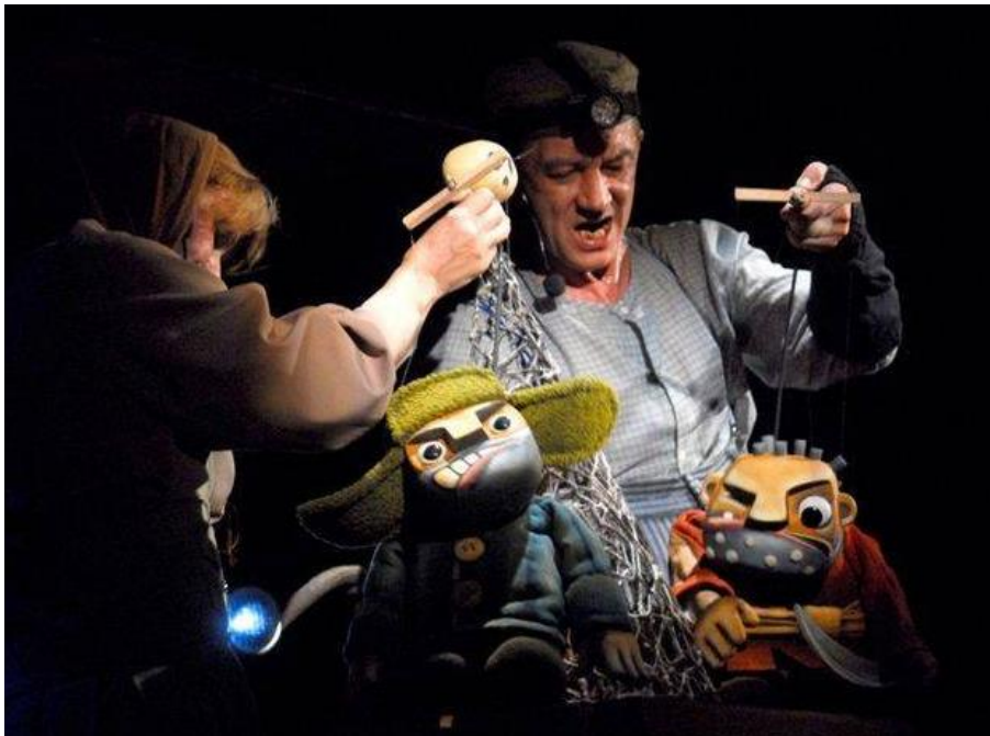
Рязанский государственный областной театр кукол

здоровья «Открой своё сердце» и областного фестиваля детского художественного творчества «Радуга талантов». Рязанский областной научно-методический центр народного творчества сотрудничает с образовательными учреждениями региона, в том числе с ФКПОУ «Михайловский экономический колледж-интернат» и общественными организациями инвалидов.