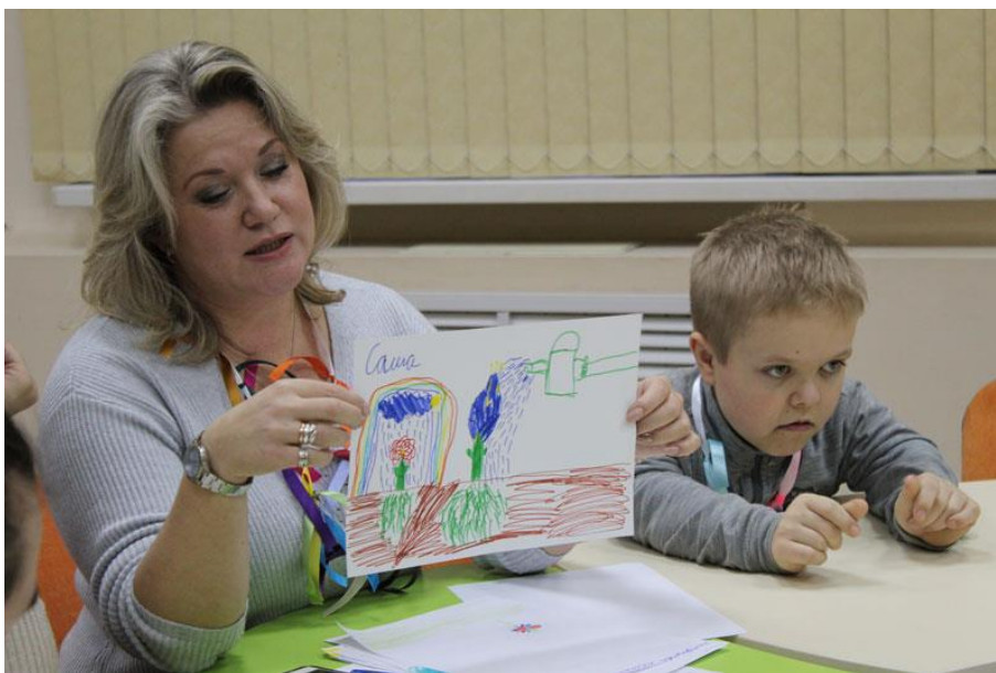
Проект «Я – родитель», ГБУК РО «Библиотека им. Горького»

В библиотеке шестой год работает известная на всю страну мультипликационная студия «Пластилиновый ёжик», созданная для «особенных» учащихся школ №№ 10 и 18, работает программа «Лечиться с книгой веселей» для детей, находящихся на лечении в городской больнице № 11.