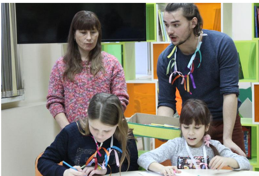
Проект «Инклюзивная театральная мастерская «Твой выход!», ГБУК РО «Библиотека им. Горького»

Библиотека имеет многолетние устойчивые связи с министерством образования и молодёжной политики, министерством труда и социальной защиты, министерством здравоохранения Рязанской области, ОГБОУ «Школа-интернат «Вера»», всеми территориальными отделениями города Рязани Рязанской областной организации общероссийской общественной организации «Всероссийское общество инвалидов».