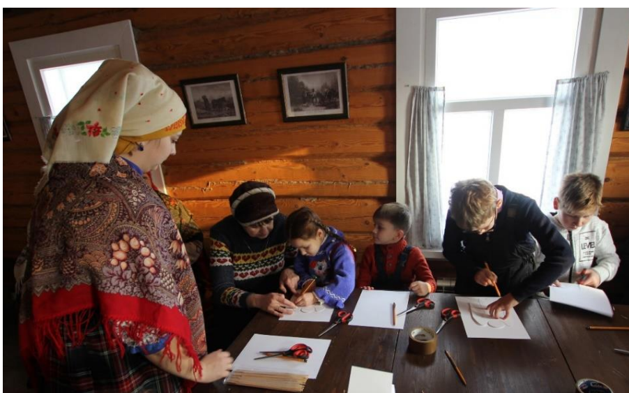
Тифлоспектакль Свадебный обряд села Константиново», ГУАК «Государственный музей-заповедник С.А. Есенина»