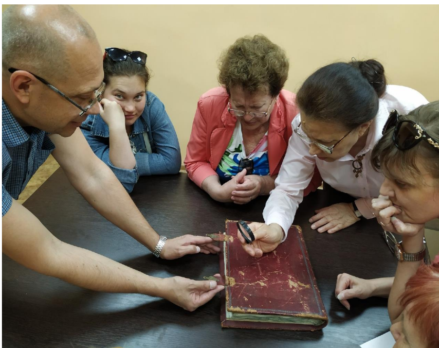
Проект «Русский язык – Отечеству основа» ГБУК РО «РОСБС»

Рязанской областной специальной библиотекой для слепых по инициативе Регионального методического центра по работе с инвалидами заключено более 30 договоров и соглашений о сотрудничестве с учреждениями Рязанской области, подведомственными государственным и муниципальным органам власти в сфере социальной защиты населения, образования, здравоохранения.