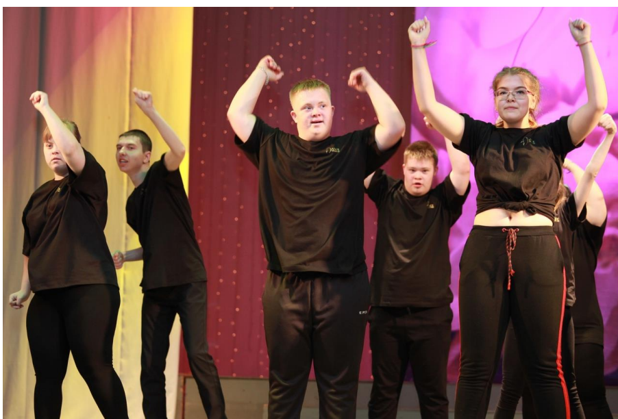
IV Межрегиональный фестиваль-форум в поддержку людей с ограниченными возможностями здоровья «Подснежник»