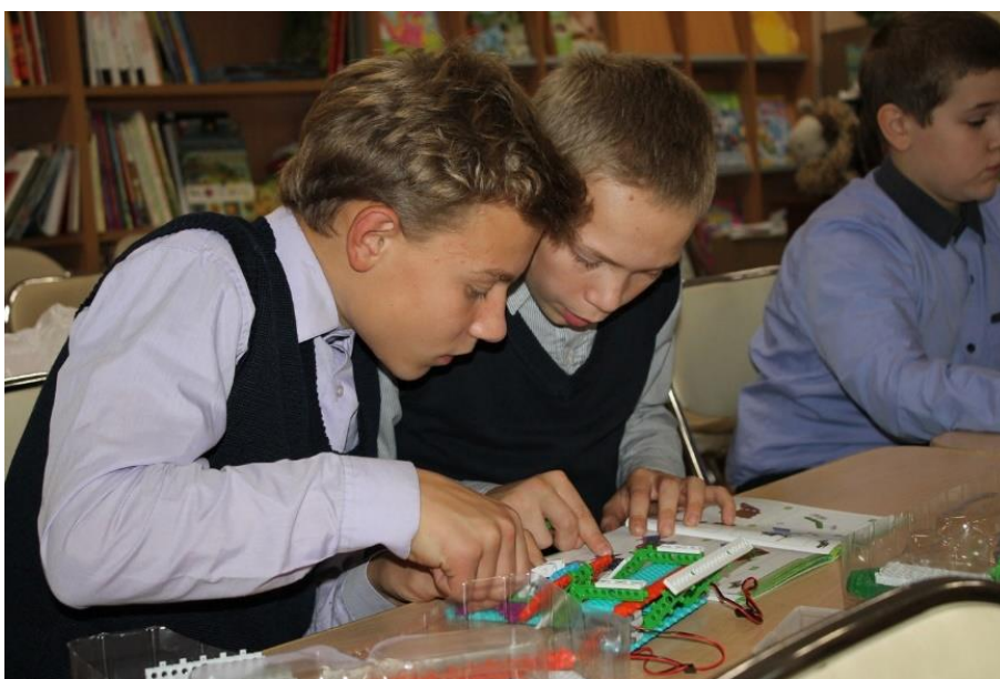
Проект «Открытая мастерская»: мастер-классы по прикладному творчеству и робототехнике для детей с ограниченными возможностями здоровья, ГБУК РО «РОДБ»

В библиотеке шестой год работает известная на всю страну мультипликационная студия «Пластилиновый ёжик», созданная для «особенных» учащихся школ №№ 10 и 18, работает программа «Лечиться с книгой веселей» для детей, находящихся на лечении в городской больнице № 11.